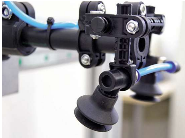
Bild 2: Die Herga-Leichtbausauger bestehen aus Kunststoff und lassen sich leicht montieren.

Die Vakuumsaugkraft lässt sich individuell an jede Anforderung anpassen (Bild 3). Einer der wichtigsten Vorteile ist für das Werk Langenzenn zudem die Zeitersparnis: